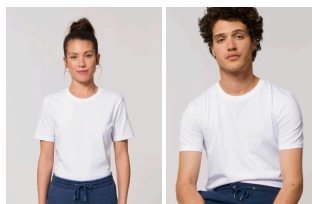
Stella Tracer Denim